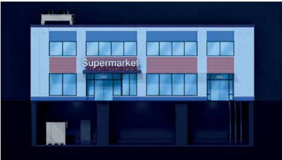
Aufgeteilte Innen/ Außenanstellung