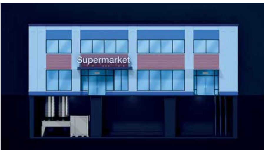
Gepackte Innen- anstellung